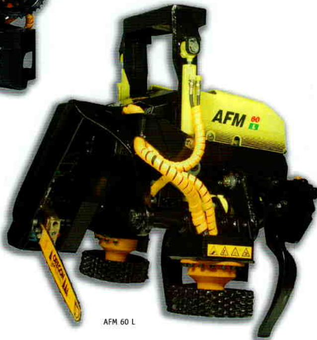
AFM 60 L

El AFM 60 L es un cabezal de gran capacidad y rendimiento diseñado especialmente para montarse sobre procesadoras forestales de ruedas. Puede adaptarse fácilmente sobre diferentes tamaños de máquinas base. El AFM 60 L tiene una gran capacidad y potencia para las cortas finales más grandes. Al mismo tiempo debido a su diseño compacto es suficientemente ligero y muy maniobrable para cortar entresacas tardías. El AFM 60 L está equipado con un par de cuchillas Heavy Duty (reforzadas) capaces de procesar hasta los árboles más difíciles. La instalación del AFM 60 L en procesadora forestal de ruedas es realmente muy fácil.