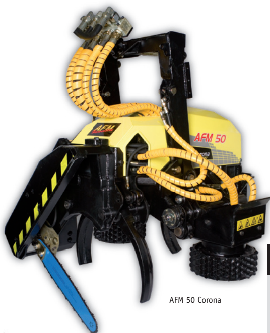
AFM 50 Corona